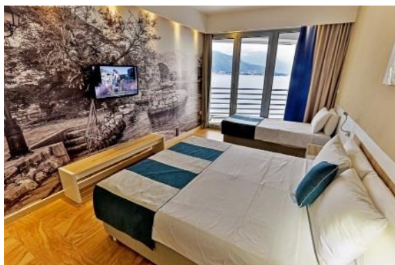
Chambre vue mer avec 3 ème lit