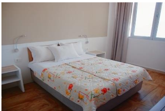
Chambre standard vue montagne