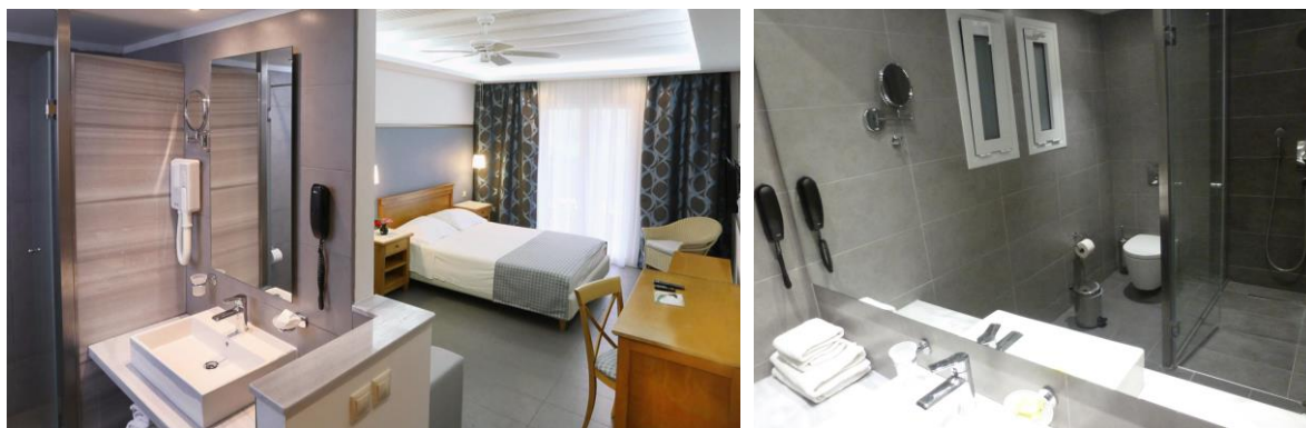
Certaines chambres sont adaptées pour les personnes à mobilité réduite (sur demande).

Chambre Familiale (36 m 2 ) : Capacité maximale : 2 adultes + 3 enfants -12 ans.